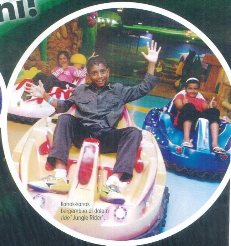
Kanak-kanak bergembira di dalam ride "Jungle Rider".

Digelar bandar lampu digital, taman tema i-City yang berukuran 25 ekar telah mendapat sambutan ramai iaitu 5.5 juta orang pengunjung pada tahun 2013. Dengan pembukaan WaterWorld@i-City, taman tema i-City ingin memberikan pengunjung pengalaman edutainment yang terbaru!