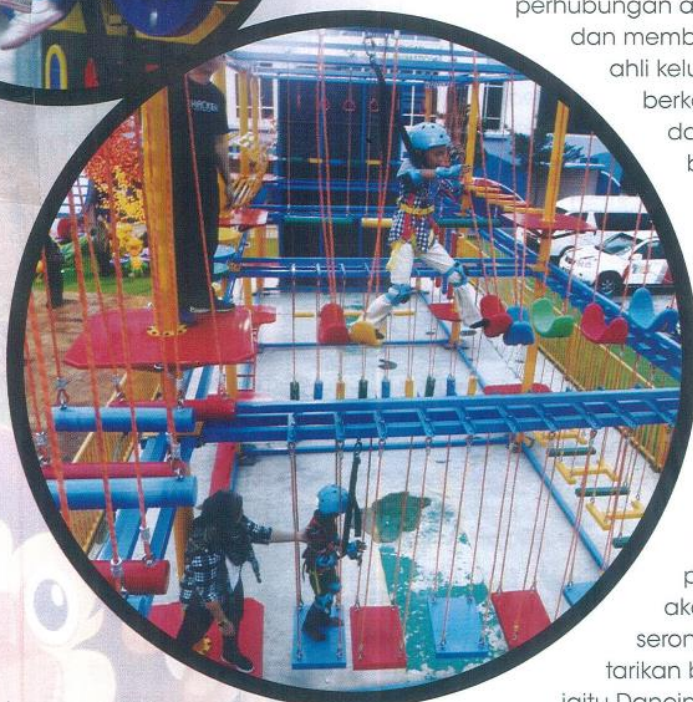
Stamina kanak-kanak diuji di Itsy Bitsy.