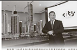
豐華公司主業產量及銷售額均錄得強勁增長，受惠於其生產、...